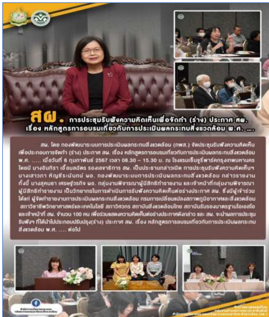
รูปที่ ๔ การจัดประชุมรับฟังความคิดเห็นฯ เมื่อวันที่ ๖ กุมภาพันธ์ ๒๕๖๗

สำนักงานนโยบายฯ ได้มีการให้ข้อมูลประกอบการรับฟังความคิดเห็น ได้แก่ ความเป็นมาของการจัดทำ ขั้นตอน และการดำเนินการจัดทำ (ร่าง) ประกาศสำนักงานนโยบายฯ รวมถึงประกาศสำนักงานนโยบายฯ เรื่อง หลักสูตรการอบรมเกี่ยวกับการประเมินผลกระทบสิ่งแวดล้อม ลงวันที่ ๒๓ กันยายน ๒๕๖๕ และ (ร่าง) ประกาศสำนักงานนโยบายฯ เรื่อง หลักสูตรการอบรมเกี่ยวกับการประเมินผลกระทบสิ่งแวดล้อม พ.ศ. .... ทั้งนี้ มีผู้แสดงความคิดเห็นต่อ (ร่าง) ประกาศสำนักงานนโยบายฯ จำนวน ๙ ราย