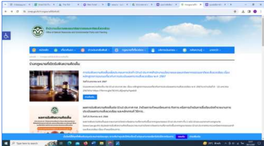
รูปที่ ๒ การรับฟังความคิดเห็นต่อร่างประกาศฯ ทาง www.onep.go.th

๑.๑.๒ ทางเว็บไซต์สำนักงานนโยบายฯ www.onep.go.th โดย กพส. ได้ขอความอนุเคราะห์ กตป. ลงแบบสำรวจการรับฟังความคิดเห็นต่อ (ร่าง) ประกาศสำนักงานนโยบายฯ เรื่อง หลักสูตรการอบรม เกี่ยวกับการประเมินผลกระทบสิ่งแวดล้อม พ.ศ. .... ผ่านเว็บไซต์ สผ. www.onep.go.th ดังรูปที่ ๒ ในระหว่างวันที่ ๘ - ๒๒ มกราคม ๒๕๖๗ นั้น ผลปรากฏว่า ไม่มีผู้เข้าร่วมแสดงความคิดเห็นต่อร่างประกาศ สำนักงานนโยบายฯ ดังกล่าว