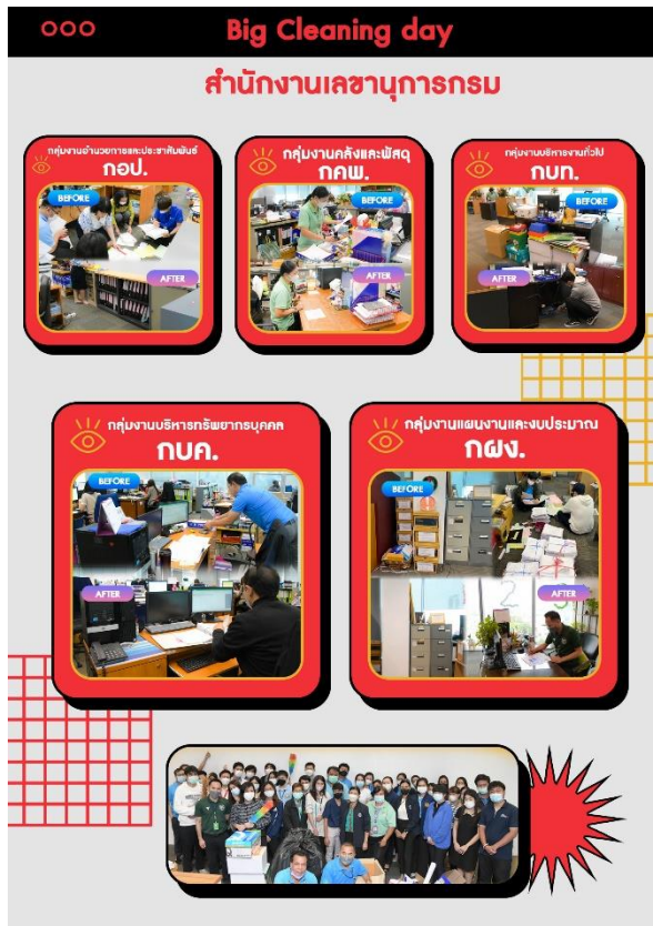
ภาพประกอบ : กิจกรรม Onep Big Cleaning Day

๑.๖ สผ. จัดกิจกรรมออกกำลังกาย ประจำปี ๒๕๖๖ อย่างต่อเนื่องในทุกวันพุธ เวลา ๑๖.๓๐ น. เป็นต้นไป โดยเริ่มตั้งแต่ วันพุธที่ ๘ มีนาคม ๒๕๖๖