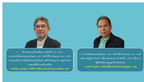
ภาพประกอบ : ผู้ได้รับคัดเลือกเป็น “คนดี ศรี สม.” ประจำปี พ.ศ. ๒๕๖๖