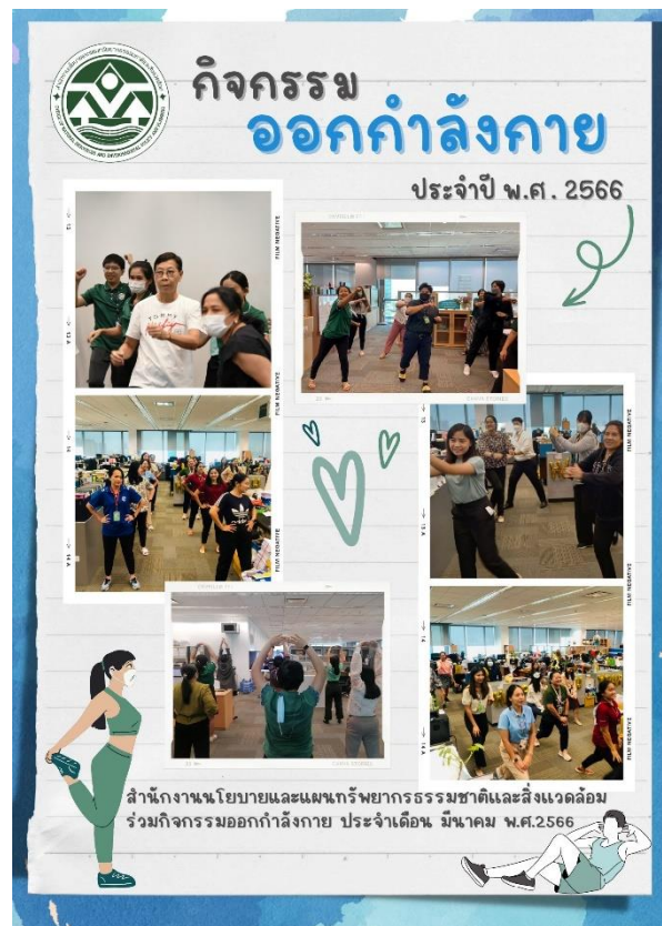
ภาพประกอบ : กิจกรรมออกกำลังกาย (สผ.)