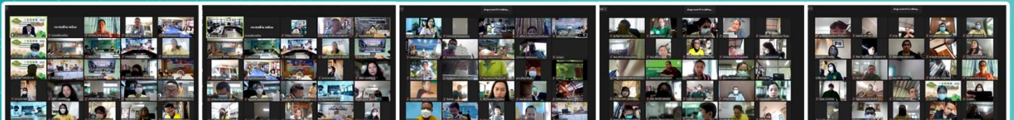
จัดทำและเผยแพร่โดย กลุ่มงานอำนวยการและประชาสัมพันธ์ สำนักงานนโยบายและแผนทรัพยากรธรรมชาติและสิ่งแวดล้อม (สพ.)

โดยงานดังกล่าว เป็นการเปิดตัวโครงการ เพื่อการเปิดรับข้อเสนอโครงการ ตั้งแต่ 1 มกราคม - 30 เมษายน 2565 โดยกองทุนสิ่งแวดล้อม /สพ. ขอมอบของขวัญปีใหม่ ปี 2565 ด้วยการสนับสนุนงบประมาณให้แก่เครือข่าย ทสม. ทั่วประเทศ โครงการละ 500,000 บาท รวมกว่า 100 โครงการ เพื่อเป็นการเสริมศักยภาพการทำงานของเครือข่าย ทสม. ซึ่งเป็นกลไกสำคัญของกระทรวงทรัพยากรธรรมชาติและสิ่งแวดล้อมในระดับพื้นที่ ในการอนุรักษ์และฟื้นฟูระบบนิเวศ โดยการทำเกษตรที่เป็นมิตรกับสิ่งแวดล้อม ภายใต้โครงการโลก หนอง นา โมเดล และการทำเกษตรกรรมยั่งยืน เพื่อการใช้ประโยชน์ทรัพยากรธรรมชาติและสิ่งแวดล้อมอย่างรู้คุณค่า และยั่งยืน สอดคล้องกับนโยบาย ทส.ยกกำลัง X และการขับเคลื่อนประเทศด้วย BCG Model