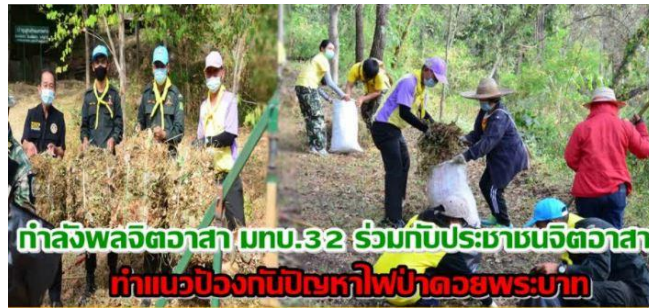
กำลังพลจิตอาสา มทบ.32 ร่วมกับประชาชนจิตอาสา ทำแนวป้องกันปัญหาไฟป่าดอยพระบาท

เมื่อวันที่ ๒๖ ธ.ค. ๖๓ ผู้สื่อข่าวรายงานว่า มณฑลทหารบกที่ ๓๒ (มทบ. ๓๒)/ศูนย์อำนวยการจิตอาสาพระราชทาน จัดกำลังพลจิตอาสา นักศึกษาวิชาทหาร จิตอาสาพระราชทาน ร่วมกับเจ้าหน้าที่ป่าไม้ สำนักบริหารพื้นที่อนุรักษ์ที่ ๑๓ สาขาลำปาง และประชาชนจิตอาสาบ้านเมาะหลวง จำนวนกว่า ๕๐ คน ร่วมกิจกรรมจิตอาสาพัฒนา ทำแนวกันไฟพื้นที่ดอยพระบาท ณ ป่าชุมชนบ้านเมาะหลวง ต. แม่เมาะ อ. แม่เมาะ จ. ลำปาง ซึ่งเป็นแนวรอยเขตติดต่อระหว่าง อ. แม่เมาะ และ อ.เมืองลำปาง โดยร่วมกันเก็บกวาดเศษกิ่งไม้ และใบไม้ เพื่อนำมาบดอัดเป็นแท่ง และจำหน่ายให้กับโรงงานพลังงานเชื้อเพลิง โดยเป็นการบริหารจัดการเชื้อเพลิงและลดปริมาณเชื้อเพลิง เพื่อเป็นแนวทางป้องกันปัญหาไฟป่าและหมอกควัน รวมระยะทาง ๑๐ กิโลเมตร