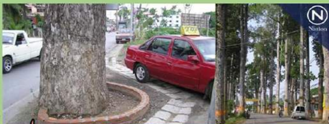
ประกาศคุ้มครองถนนเชียงใหม่-ลำพูน อู่รถยกบางกอก-ต้นซึกสิบลมยร.5