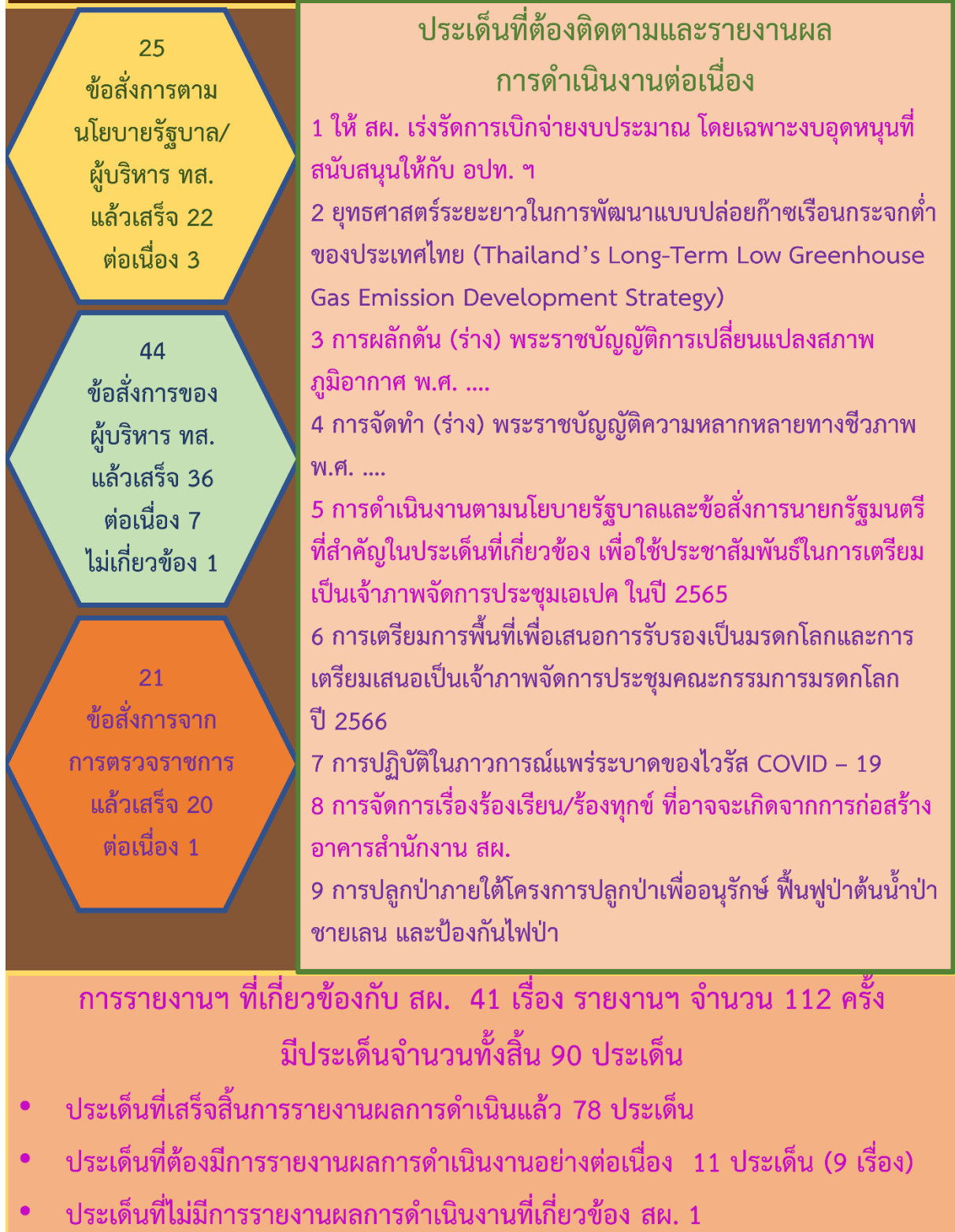
ภาพที่ 5 การติดตามผลการดำเนินงานตามข้อสั่งการที่เกี่ยวข้องกับ สผ. ประจำปีงบประมาณพ.ศ. 2565