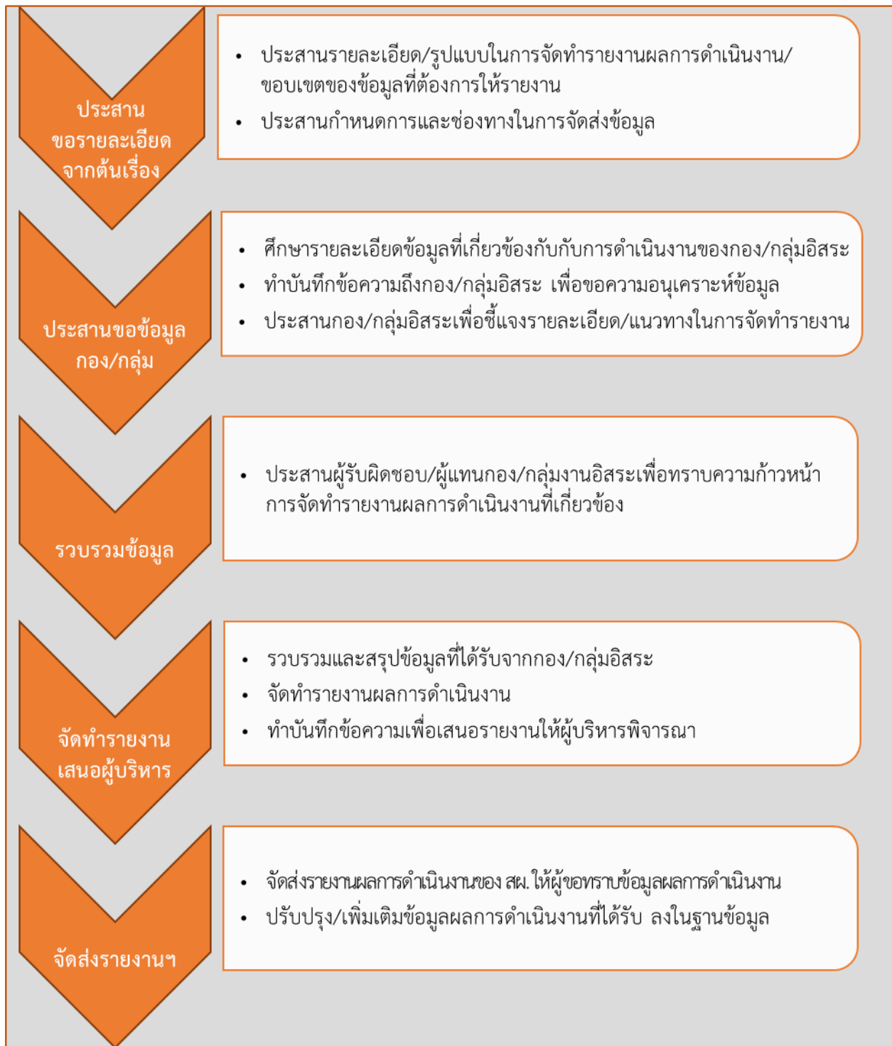
ภาพที่ ๓ ขั้นตอนการติดตามผลการดำเนินงานตามข้อสั่งการ การตรวจราชการ และนโยบายที่เกี่ยวข้องกับ สผ.