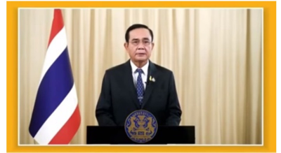
UN SUMMIT ON BIODIVERSITY

เป็นการประชุมระดับประมุขแห่งรัฐและหัวหน้ารัฐบาลผ่านระบบทางไกล จัดขึ้นเมื่อวันที่ 30 กันยายน 2563 ในระหว่างการประชุมสมัชชาสหประชาชาติ สมัยสามัญ ครั้งที่ 75 ณ นครนิวยอร์ก สหรัฐอเมริกา มีวัตถุประสงค์หลักเพื่อเน้นย้ำถึงความจำเป็นเร่งด่วนของการดำเนินการในระดับสูงสุด การสนับสนุนกระบวนการจัดทำกรอบงานความหลากหลายทางชีวภาพของโลกหลังปี ค.ศ. 2020 วาระการพัฒนาที่ยั่งยืน ค.ศ. 2030 และการบรรลุวิสัยทัศน์ความหลากหลายทางชีวภาพในปี ค.ศ. 2050 ทั้งนี้ นายกรัฐมนตรีได้ให้เกียรติร่วมกล่าวถ้อยแถลงในการหารือระดับผู้นำ 1 ในหัวข้อ “Addressing biodiversity loss and mainstreaming biodiversity for sustainable development” โดยเน้นย้ำความสำคัญของปัญหาการลดลงของความหลากหลายทางชีวภาพและความเสื่อมโทรมของระบบนิเวศ และความเป็นหนึ่งเดียวของรัฐสมาชิกสหประชาชาติเพื่อร่วมกันรับมือกับความท้าทายที่เกิดขึ้นในปัจจุบันและในอนาคต โดยประเทศไทยได้แบ่งปันประสบการณ์ด้านการจัดการกับปัญหาความหลากหลายทางชีวภาพในประเทศ รวมทั้งย้ำความสำคัญของความร่วมมือกันระหว่างทุกภาคส่วน เพื่อปกป้องความหลากหลายทางชีวภาพให้อยู่คู่กับโลกต่อไป ( https://www.cbd.int/article/2020-UN-Biodiversity-Summit/statements )